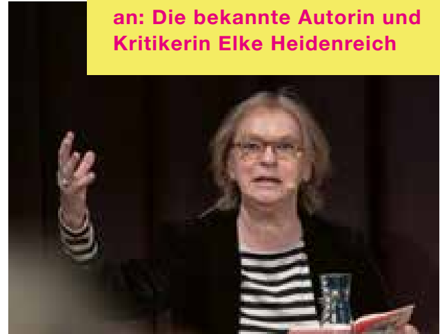
Regte im Mai 2024 zum Nachdenken über das Thema Altern an: Die bekannte Autorin und Kritikerin Elke Heidenreich

In über hundert Veranstaltungen mit rund 13'000 Besucherinnen und Besuchern jährlich stellt es Autorinnen und Autoren vor und literarische und gesellschaftliche Fragen zur Diskussion. Mit verschiedenen Projekten – allen voran mit seinem «writer in