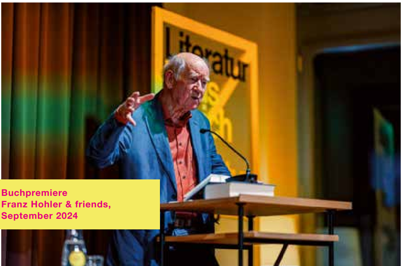
Buchpremiere Franz Hohler & friends, September 2024

2025 wurden Bibliothek und Lesesaal der Museumsgesellschaft im Rahmen eines Bibliotheksratings der schönsten Bibliotheken der Schweiz von SRF im Februar 2025 als «literarischer Schatz» gewürdigt.